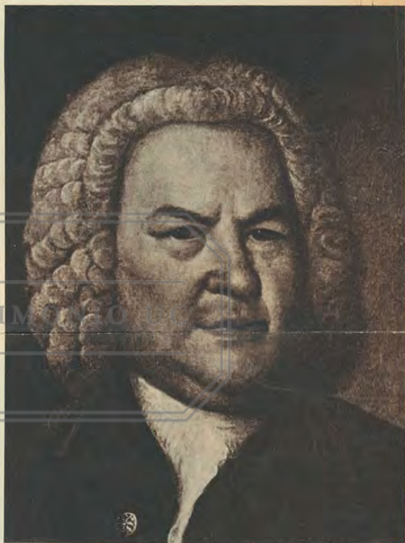
BACH.— Su ODA FUNEBRE, expresión de dolor en el barroco.

Duodécimo concierto de la Orquesta Sinfónica.— Además de la Oda Fúnebre, comentada más arriba, el programa comprendió los Tres Nocturnos para Orquesta, de Debussy, y la Sinfonía "La Noche de Cristal", de León