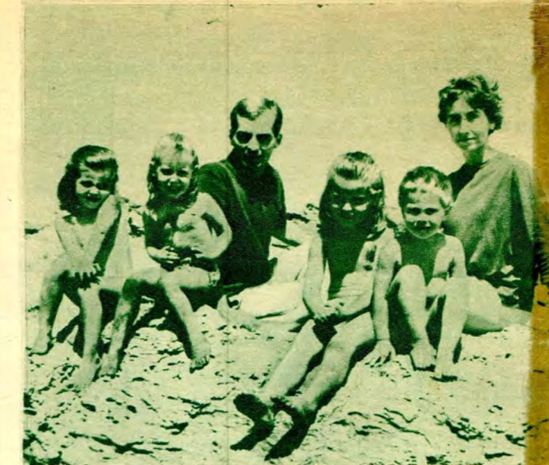
A LOS 21 AÑOS. El director orquestal chileno premiado en Nueva York se casó muy joven. Aquí resalta su serenidad que llama la atención a los grandes músicos, acostumbrados con directores temperamentales.