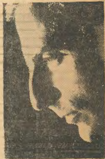
JUAN PABLO IZQUIERDO