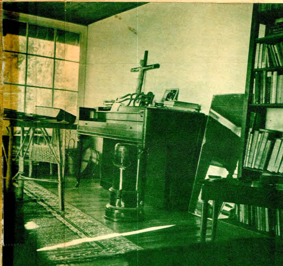
EL ESTUDIO. El joven director estudia nueve horas diarias. La pieza, en medio de árboles, le permite concentrarse y prepararse bien para cada presentación.

cia de las interpretaciones, y por eso, quizás, da una impresión de seguridad que se transmite a todo el auditorio. Cuando está en Chile, vive en los cerros precordilleranos, en medio de la naturaleza. Su estudio, un cuarto al fondo de la casa, está rodeado de árboles. Adentro, una piano que toca desde su niñez; un estante lleno de libros y carpetas; algunos muebles sobrios; un Cristo tallado y algunos fetiches. También la foto autografiada del maestro Scherchen y otras cosas pequeñas dan un aspecto de ordenado desorden. Allí se encontraba estudiando a la vuelta de Argentina, cuando recibió la noticia de que había sido agraciado con la beca Fulbright, por seis meses, para viajar a EE. UU. a dar conciertos y estudiar en los principales centros musicales del país.