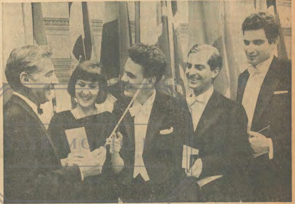
The New York Times (by Larry Morris)

None of these conductors is in any respects an amateur. Each has had thorough training, and each had some professional work. The luck of the draw also determined the music they were given to conduct. Naturally Mr. Lombard, with the wild Bartók score, was inevitably bound to make a more flamboyant impression than, say, Mr. Gillessen with the "Siegfried Idyll."