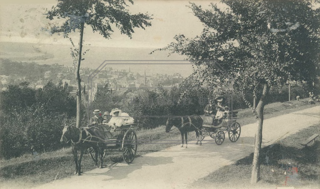
1 HOULGATE. — La Route de Villers et vue sur Houlgate. — LL.