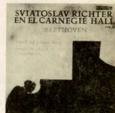
Sviatoslav Richter en el Carnegie Hall - Vol. II