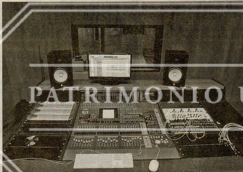
El moderno Estudio del GAM debutará en el ámbito de la música clásica con los sonidistas de Radio Beethoven, quienes han grabado más de 200 conciertos.

“Vamos a partir con la versión de cámara que hizo Arnold Schoenberg de la Cuarta Sinfonía de Mahler. ¡Pero este proyecto no es grabar solamente un disco! La firma me ha encargado una serie larga, de diez o quince discos. Naturalmente es un plan a varios años plazo. El propósito es grabar todas las versiones de cámara que se hicieron en la sociedad privada de