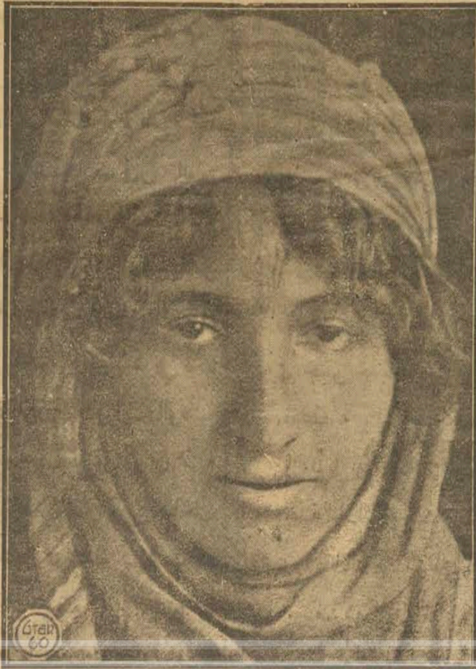
فتاة عربية - بربرية من حسان الريف

معارك الاسبوع - خسائر الفرنسيين - خداع اوربا ونفاقها