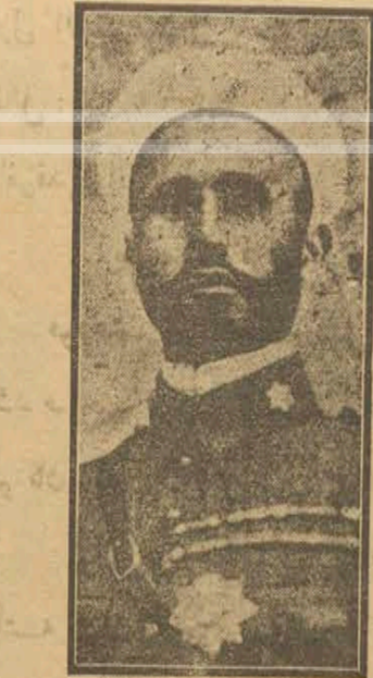
القائد عبد القادر من قبيلة بني صغار متحدر من دم عربي ويزنزي الضابط البربري محمد بن بوعمرائي في خدمة اسبانيا

نشبه دول اوربا عصاة للصوم انفتحت على الرموق الى قرية لتنهيب ونسلب . ولما كان طبع الاوربي كطبع الذئب، شراسة وشراسة وغدرآء كان الواحد من العصاة يخشى ان يعقره اخوه اذا سارا في سبيل واحد وكانت خشية الفدر سبب اكثر