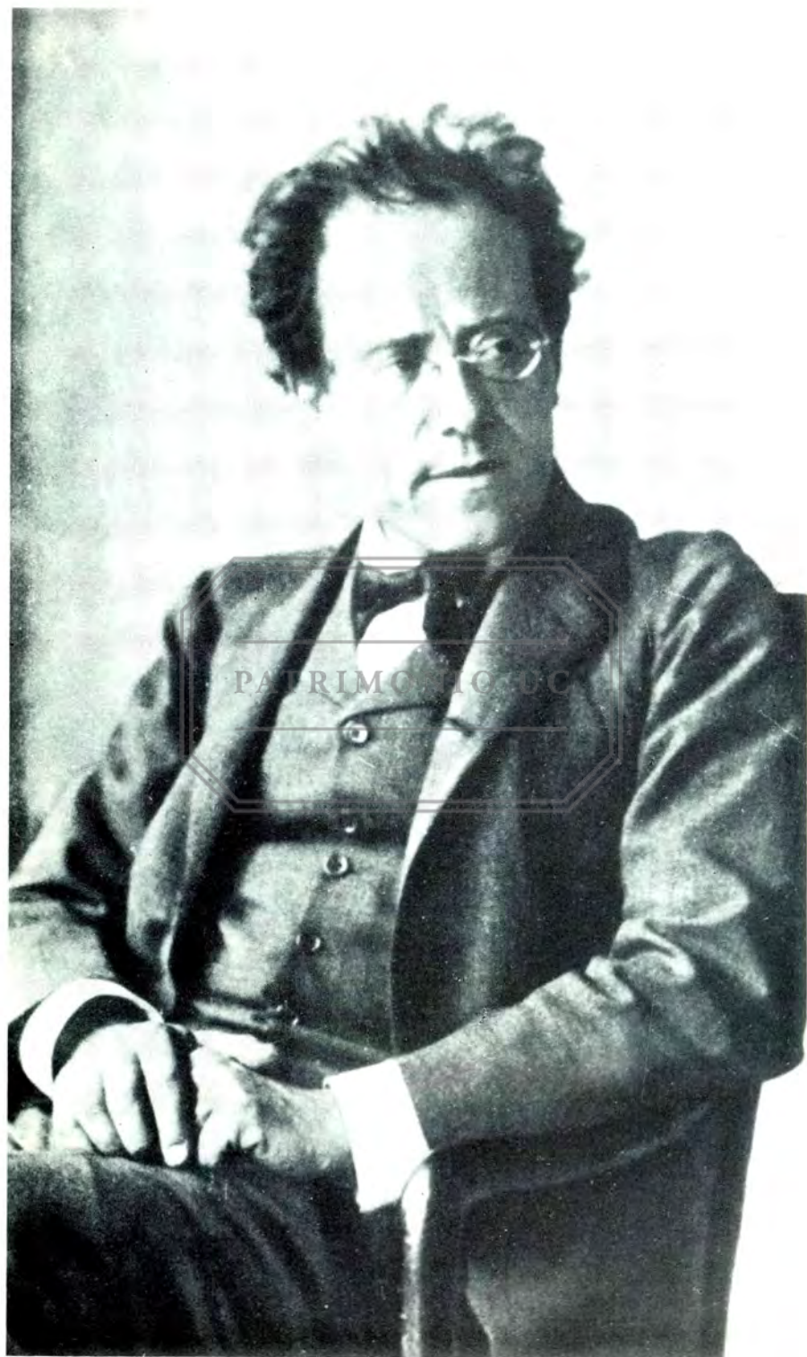
Mahler en un palco de la Opera de Viena en 1907