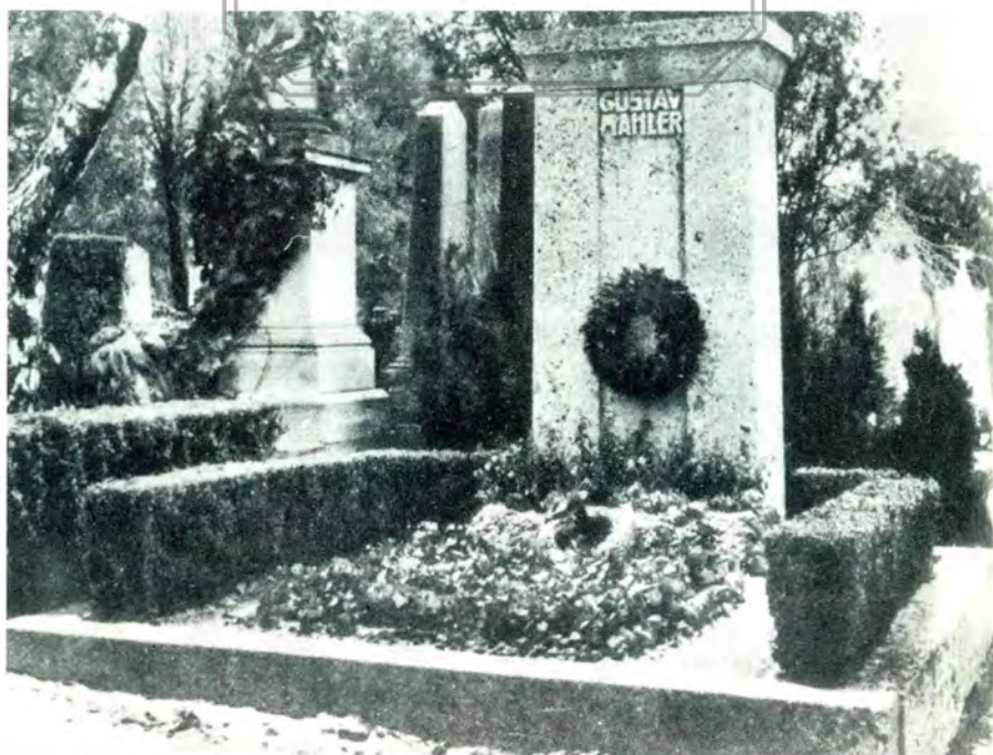
Tumba de Mahler en Viena (Cementerio de Grinzing)