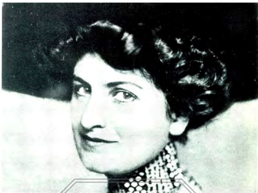
Ana María Mahler en 1909