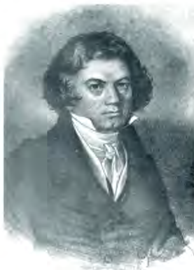
Ludwig van Beethoven

El desarrollo de todo el arte orquestal, que tiene sus albores en el siglo XVII, se puede mostrar como un proceso continuado y progresivo hasta esta sinfonía, más que a cualquier otra obra, ya que casi toda la obra sinfónica posterior, grandiosa y magnificante, tiene su punto de partida en el concepto orquestal beethoveniano.