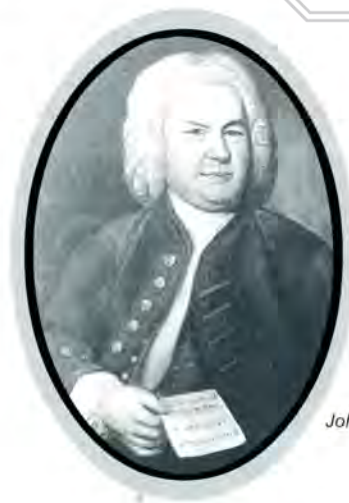
Johann S. Bach

La contribución de Johann Sebastian Bach al desarrollo de la Cantata de Iglesia constituye uno de los aspectos más vigorosos de su extensa obra. La cantata clásica alemana en su concepto compositiva se hallaba en un momento de estancamiento, tanto en estructura como en