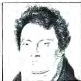
LUDWIG VAN BEETHOVEN (1770 - 1827)