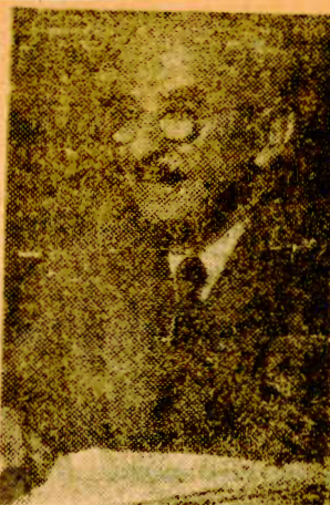
El Contralor Bahamonde Ruiz. Busca otra manera de pagar, las instituciones y no salario, venta, cualquiera que la modalidad ideada. BUSCA otra manera de pagar, las instituciones y no salario, venta, cualquiera que la modalidad ideada. BUSCA otra manera de pagar, las instituciones y no salario, venta, cualquiera que la modalidad ideada.

Sin embargo, son éstos los problemas matrices de una política de comercio exterior. Y alguna vez tendrán que ocupar el centro del mapa en la atención de la Izquierda.