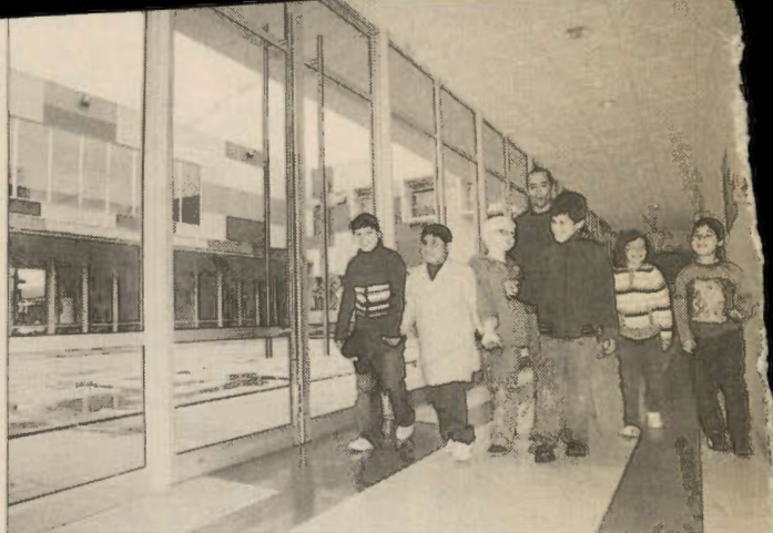
MÁS LUZ. — La nueva Escuela Santa Lucía está llena de ventanales que permiten una mayor apertura a la comunidad.

Para el plan, que se prolongaría hasta 1970, los norteamericanos destinaron un millón de dólares y el Gobierno de Eduardo Frei Montalva puso sobre la mesa otros dos millones de escudos. Hasta que la llegada de la Unidad Popular al poder pondría fin a la iniciativa.